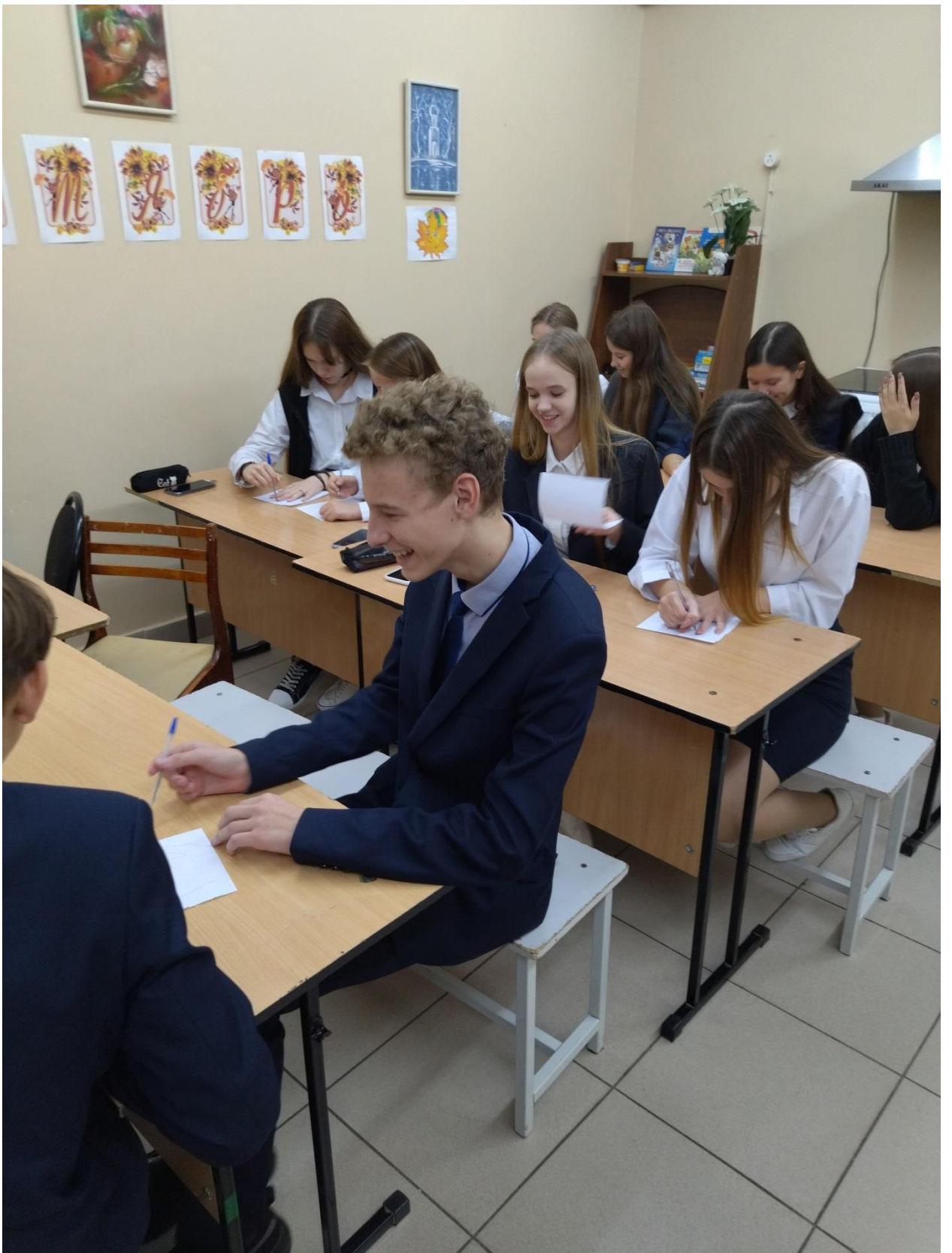
9а «Рисование своей ладони»