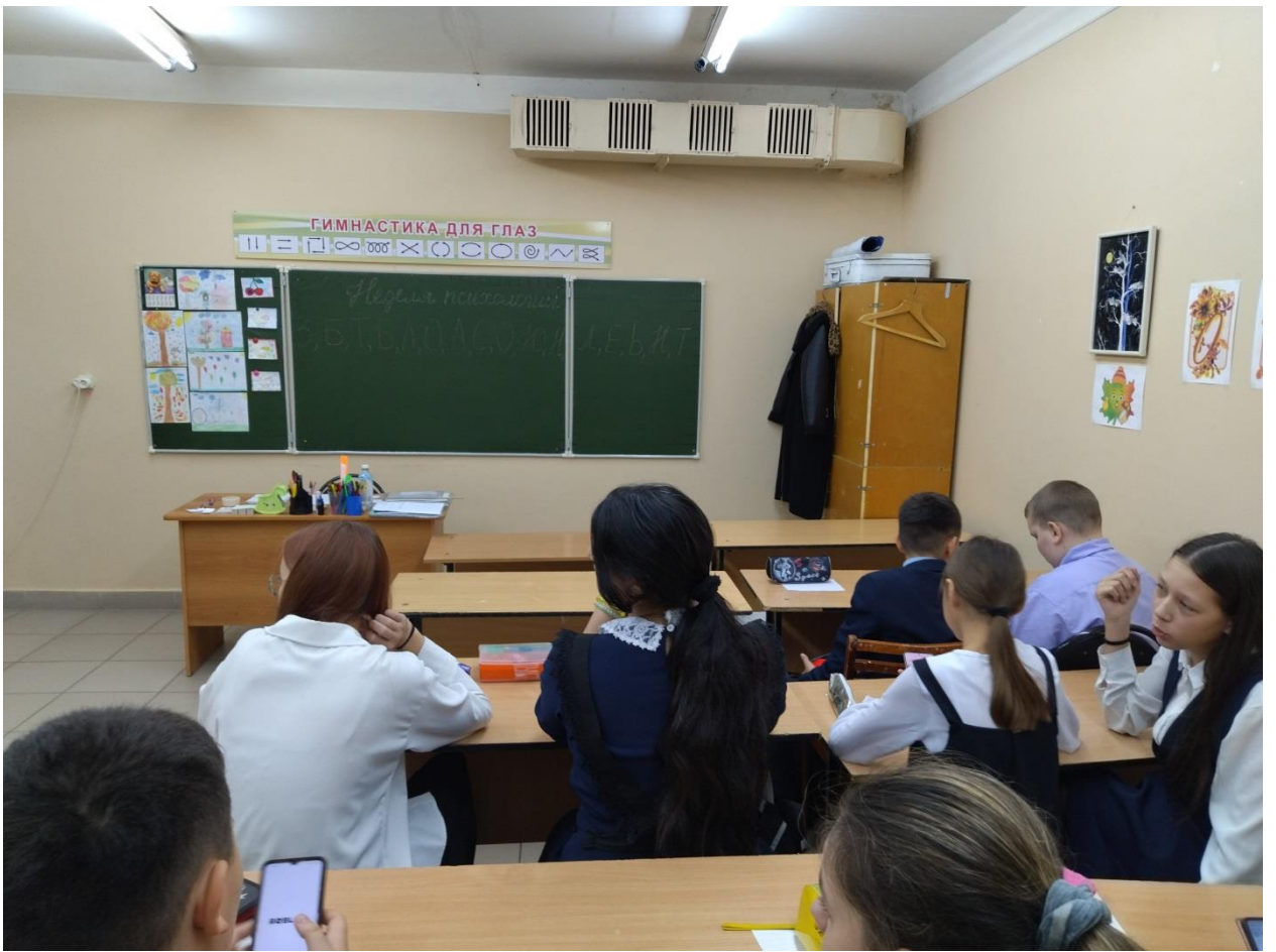
6г «Составь слово»