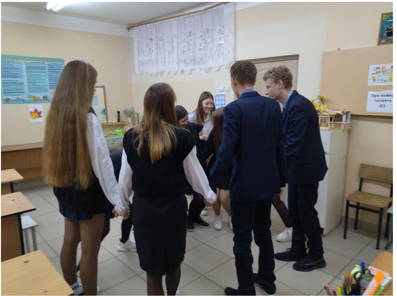
9а «Я и круг»