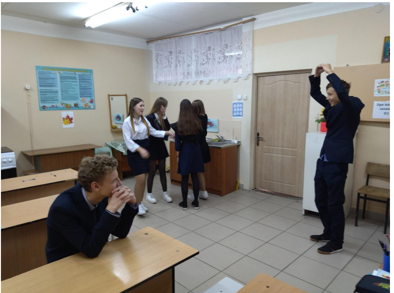
9а «Прогулка в парке»