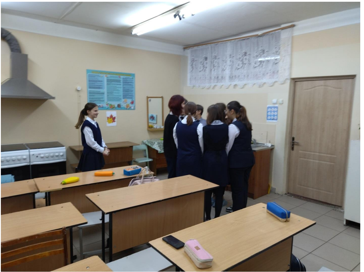
7а «Я и круг»