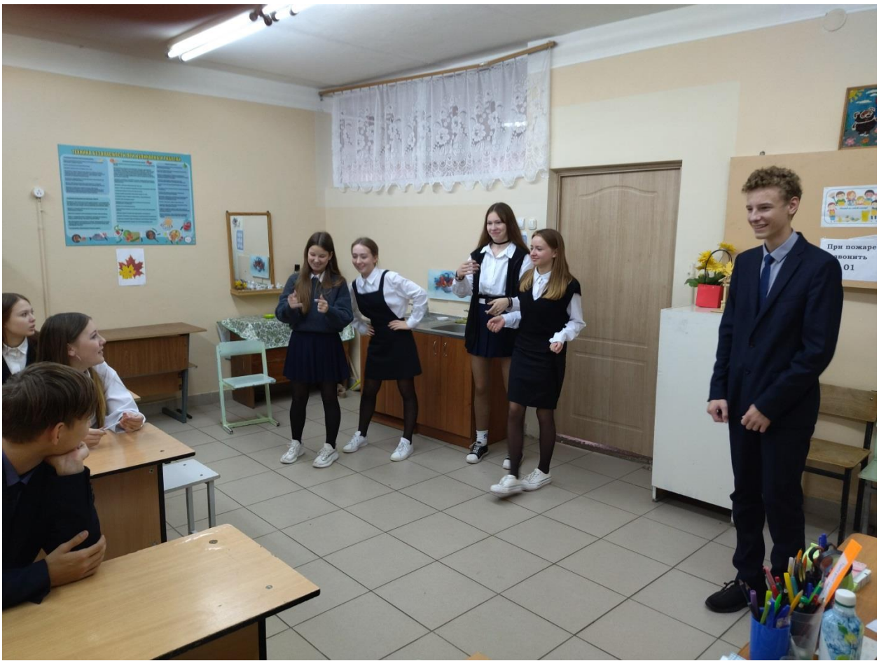
9а «Покажи фразу»