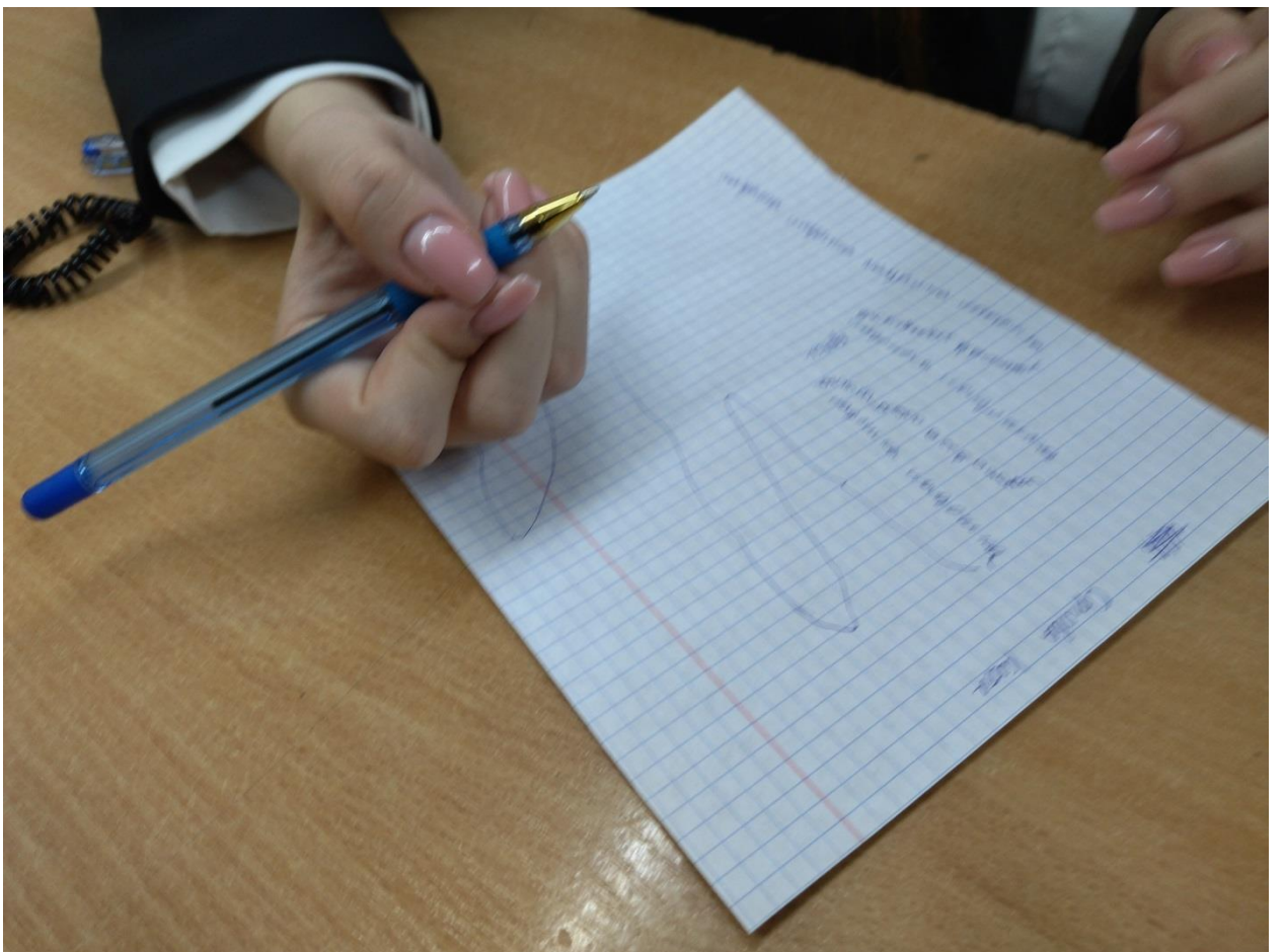
9а «Рисование своей ладони»