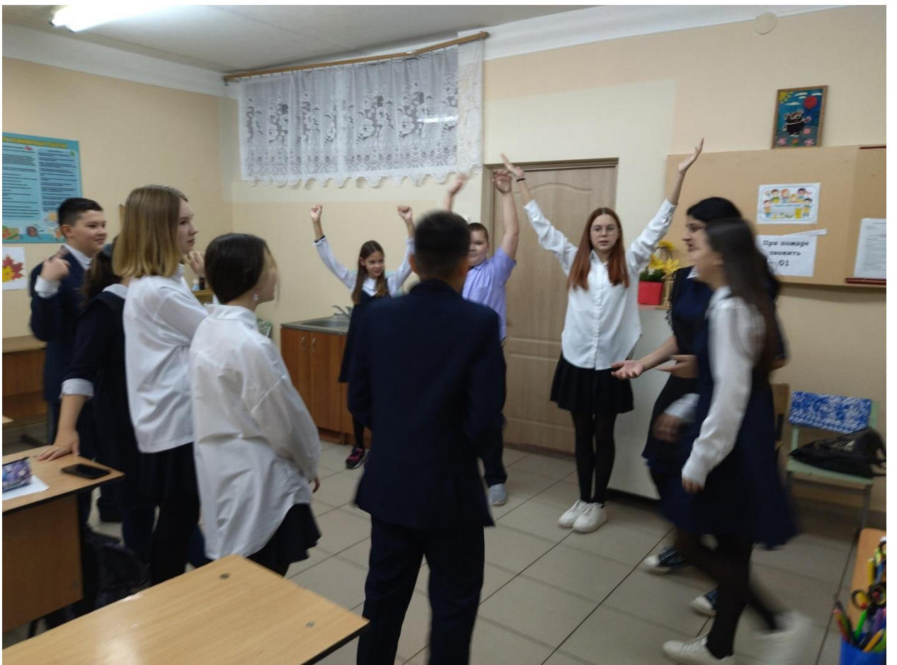
бг «Покажи фразу»