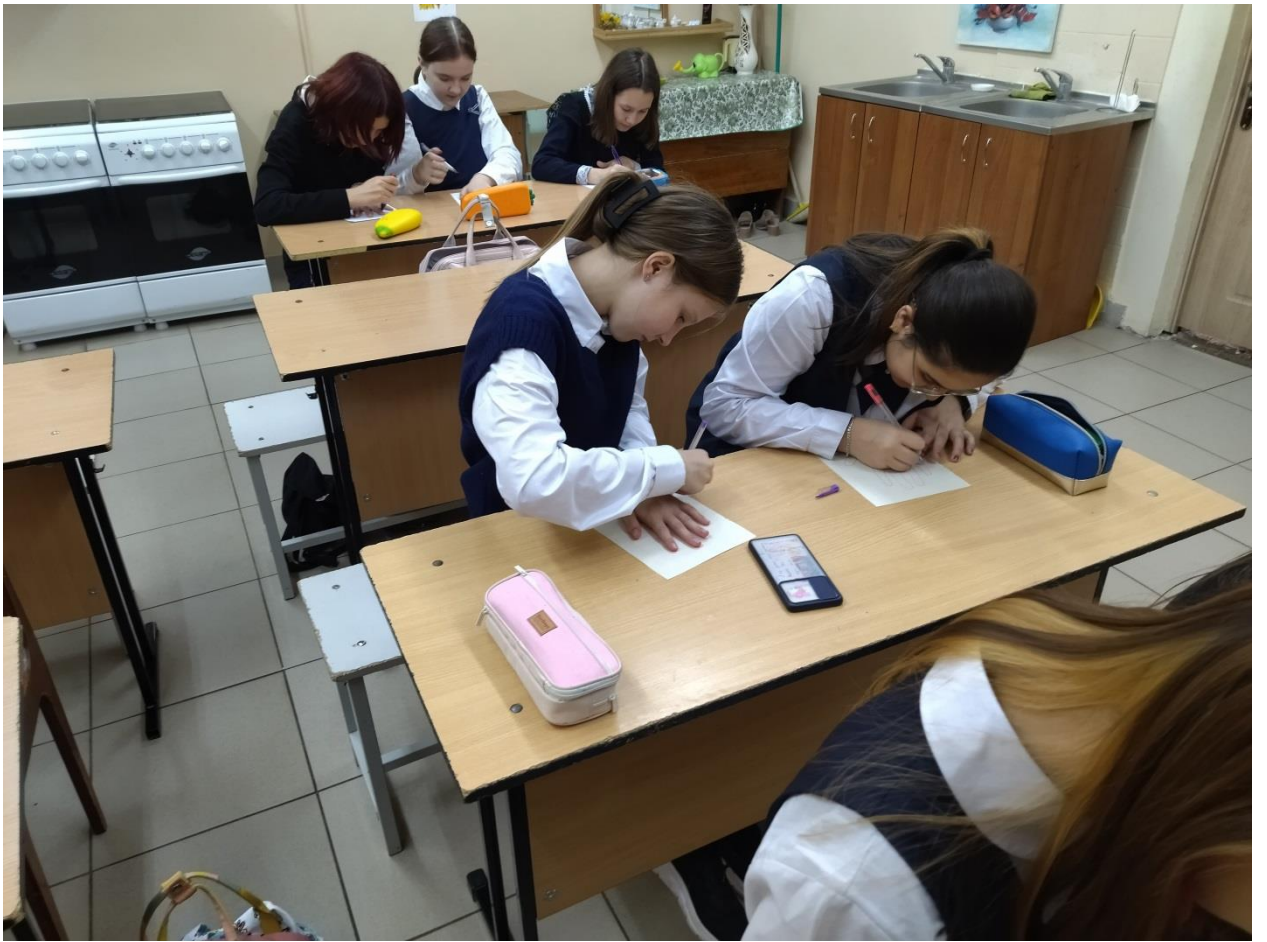
7а «Рисование своей ладони»